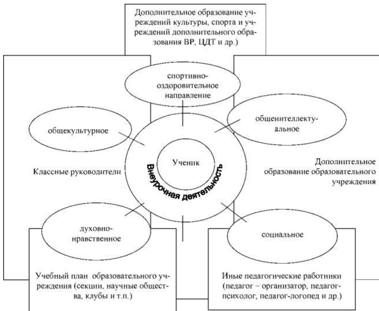
Рис. Оптимизационная модель внеурочной деятельности

Исходя из задач, форм и содержания внеурочной деятельности, для её реализации была выбрана оптимизационная модель.